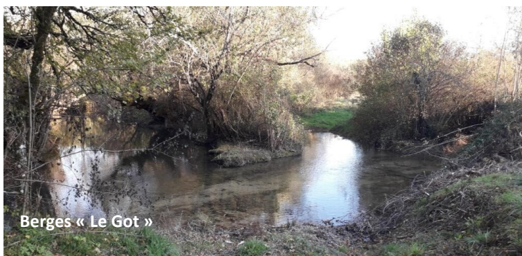
Berges « Le Got »

Une réunion publique est donc prévue à cet effet ultérieurement afin de répondre aux questions et aux attentes des riverains propriétaires qui souhaiteraient intervenir sur les berges des ruisseaux (réunion qui se tiendra en présence des représentants du SMBVVD).